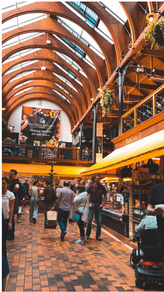
The English Market